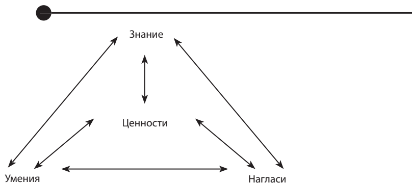
Фигура 13. Ключови умения за образованието по европейско гражданство

Трябва обаче да се отбележи, че именно ценностите трябва да задават идентификацията на целите и да бъдат “притегателният център”, постоянният източник на образованието по европейско гражданство, където всички измерения и сфери намират свой израз и баланс. Разбира се, образованието по европейско гражданство трябва да дава на младите хора възможност да се замислят за своите ценности, идентичност и връзки на принадлежност към общността или общностите по техен избор и би следвало да допринасят за превръщането им в активни дейци както в защитата, така и в пропагандирането на своите ценности.